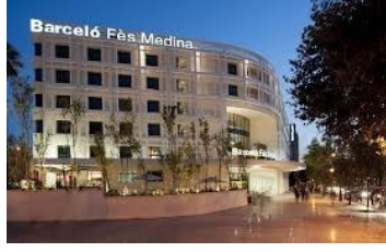
FEZ BARCELO FEZ MEDİNA HOTEL 4* Avenue Hassan 2 Fez MAROCCO Tel : +212 535-948800