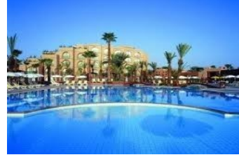
MAREKESH HOTEL PALM PLAZA 5* Avenue du 7 eme Marakesh MAROCCO Tel : +212 24388700

NOT: Minimum 20 kişi ve üstü içindir grup sayısı bu rakamın altında kaldığında yeni fiyat belirlenir. Uçak gemi ve otellere ve gelebilecek zamlar gezi ücretine yansıtılır Gezi ücretine 1618 sayılı Türsab Mesleki Sorumluluk sigortası DAHİLDİR . Sadece SEYAHAT SAĞLIK Sigortası veya Gezi ücretinin tamamının yatırılması ve kayıttan 7 iş günü içinde yapılması kaydıyla gezi ücretinin % 80 i kadarına iade sağlayabilen İPTAL/İADE sigortası DAHİL DEĞİLDİR . 70 yas üstü kişilere sür prim uygulanır. Sigorta talebiniz var ise kayıt anında satış elemanımıza iletiniz.