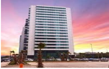
KASABLANKA RYAD MOGADOR MARİNA HOTEL 4* Rue Ait Ba Amrone 20 Casablanca MAROCCO Tel : +212 530-530530