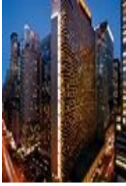
NEWYORK SHERATON TIMES SQUARE HOTEL