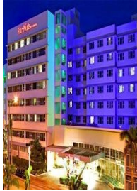
MİAMI SHERATON FOUR POINTS HOTEL