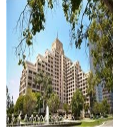
LOS ANGELOS INTERCONTINENTAL AT CENTURY CITY HOTEL