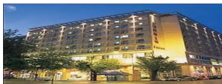
SELANİK- CAPSİS HOTEL 4*