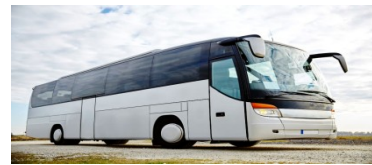
46 KİŞİLİK BÜYÜK ARACIMIZ