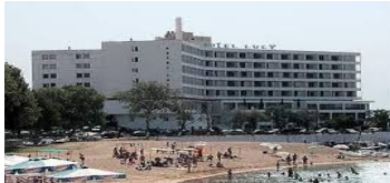
KAVALA - LUCY HOTEL 4* PLAJ- HAVUZ