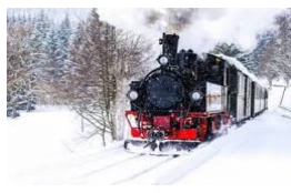
TRANS SIBİRYA TRENI