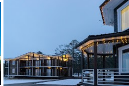
OTHON ADASI PORT HOTEL 3*