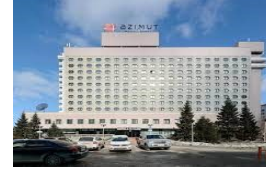
NOVOSİBİRSK AZİMUT HOTELSİBERİA 3*

NOT :GEZİ BAŞLANGIC TARİHİNDEN İTİBAREN MINIMUM 6 AYLIK PASAPORT GEREKMEKTEDİR.. GEZİ FİYATIMIZA TÜRSAB MESLEKİ SORUMLULUK SİGORTASI DAHİLDİR. 70 YAŞ ÜZERİ MİSAFİRLERİMİZE SÜR PRİM UYGULANIR.