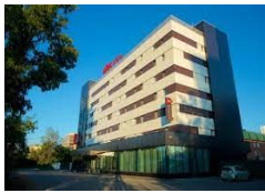
İRKUTS İBİS HOTEL 3*