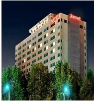
MEXICO CITY RAMADA BY WYNDAM HOTEL 4*