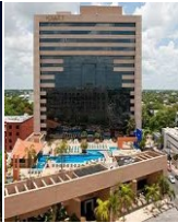
MERİDA NH MERIDA PASEO HOTELL 4*