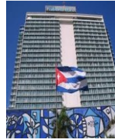
HAVANA TRYPE HAVANA LIBRE HOTEL 4*