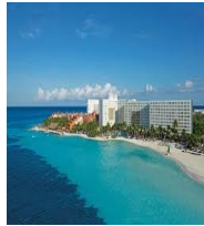
CANCUN WYNDAM ALTRA RESORT HOTEL 4*