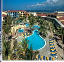
TRİNİDAD BRİSAS TRİNİDAD DEL MAR HOTEL 4* ( Herşeydahil)