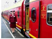
NOSTALJİK YATAKLI RUS TRENİ LUX*