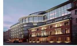
ST PETERSBURG AMBASSADOR HOTEL 4*