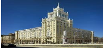
MOSKOVA NOSTALJİK PEKİN HOTEL 4* Veya benzeri otellerdir.