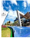
IGUASU VIALE C. HOTEL 4*