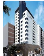
LİMA SHERATON HOTEL 4*