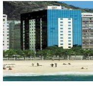
RİO DE JENERİO OTHON HOTEL 4*