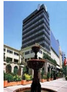
SANTIAGO PLAZA S.F HOTEL 4*