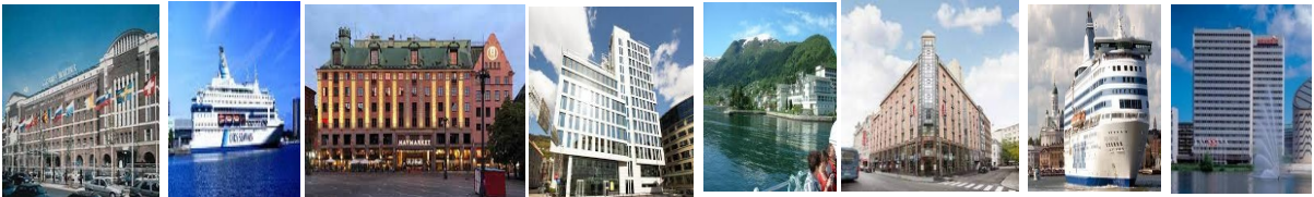
HELSİNKİ GRAND MARİNA 4* SİLJA LİNE FERİBOT STOKHOLM HOTEL C STOCKHOLM 4* SCANDİC ORNEN 4* BERGEN MRYDAL HTL 4* CLARION THE HUB 4* DFDS OSLO GEMİ FERRY KOPENHAG IMPERIAL HOTEL 4*