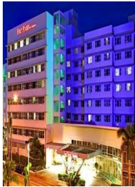
MIAMI SHERATON FOUR POINTS HOTEL