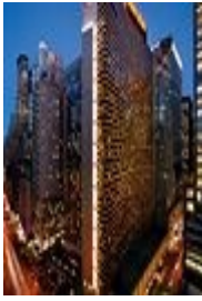
NEWYORK SHERATON TIMES SQUARE HOTEL