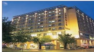
SELANİK- CAPSİS HOTEL 4 *