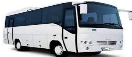
27 KİŞİLİK MITSUBİSHI ARACIMIZ