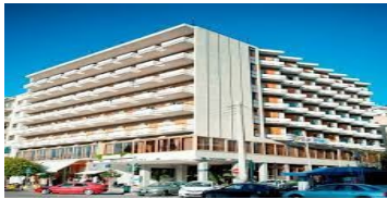
KAVALA - LUCY HOTEL 5* VEYA EMSAL OTELLERDİR