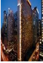
NEWYORK SHERATON TIMES SQUARE HOTEL VEYA BENZERİ OTELLER