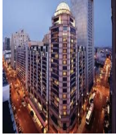
SAN FRANCİSCO HİLTON UNION SQUARE HOTEL