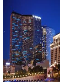
LAS VEGAS COSMOPOLİTAN LAS VEGAS HOTEL