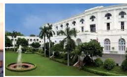
YENİ DELHİ MAİDEN HOTEL 5*