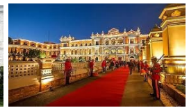
KATMANDU HOTEL YAK & YETİ 5*

Minimum 20 maximum 24 kişi içindir. Grup sayısı minimum rakamın altında kaldığında yeni fiyat belirlenir. Uçak,otelere ve gelebilecek zamlar gezi ücretine yansıtılır Gezi ücretine 1618 sayılı Türsab Mesleki Sorumluluk sigortası DAHİLDİR . Sadece SEYAHAT SAĞLIK Sigortası veya Gezi ücretinin tamamının yatırılması ve kayıttan 7 iş günü içinde yapılması kaydıyla gezi ücretinin % 80 i kadarına iade sağlayabilen İPTAL/İADE sigortası DAHİL DEĞİLDİR . 70 yas üstü kişilere sür prim uygulanır. Sigorta talebiniz var ise kayıt anında satış elemanımıza iletiniz.