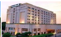
VARANASI RADISSON HOTEL 5*