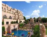
AGRA TRIDENT HOTEL 5*