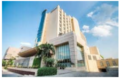
JAIPUR HILTON HOTEL 5*