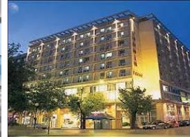
Selanik-Capsis hotel 4*