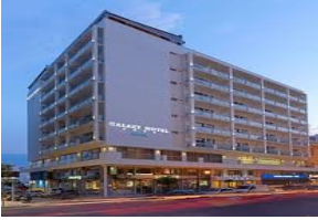
Kavala- Galaxy hotel 4* Vb otellerdir