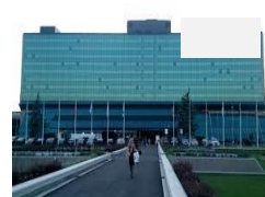
BELGRAD CROWN PLAZA HOTEL 5*