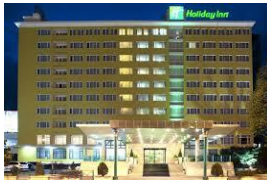
ÜSKÜP HOLIDAY İNN USKUP HOTEL 5*