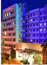
MİAMI SHERATON FOUR POINTS HOTEL