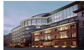
ST PETERSBURG AMBASSADOR HOTEL 4*