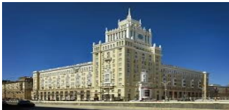
MOSKOVA NOSTALJİK PEKİN HOTEL 4* Veya benzeri otellerdir.