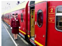
NOSTALJİK RUS TRENİ LUX*